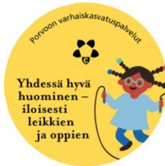
Kuva 1. Porvoon kaupungin varhaiskasvatuspalvelujen visio 2026–2030. (Kuvitus Maija Blomqvist)

”Porvoon kaupungin varhaiskasvatuspalveluissa rakennamme laadukasta arkea yhdessä. Ohjaavien asiakirjojen sekä kaupungin strategian arvot, tavoitteet ja painopisteet viitoittavat työmme suunnan.”