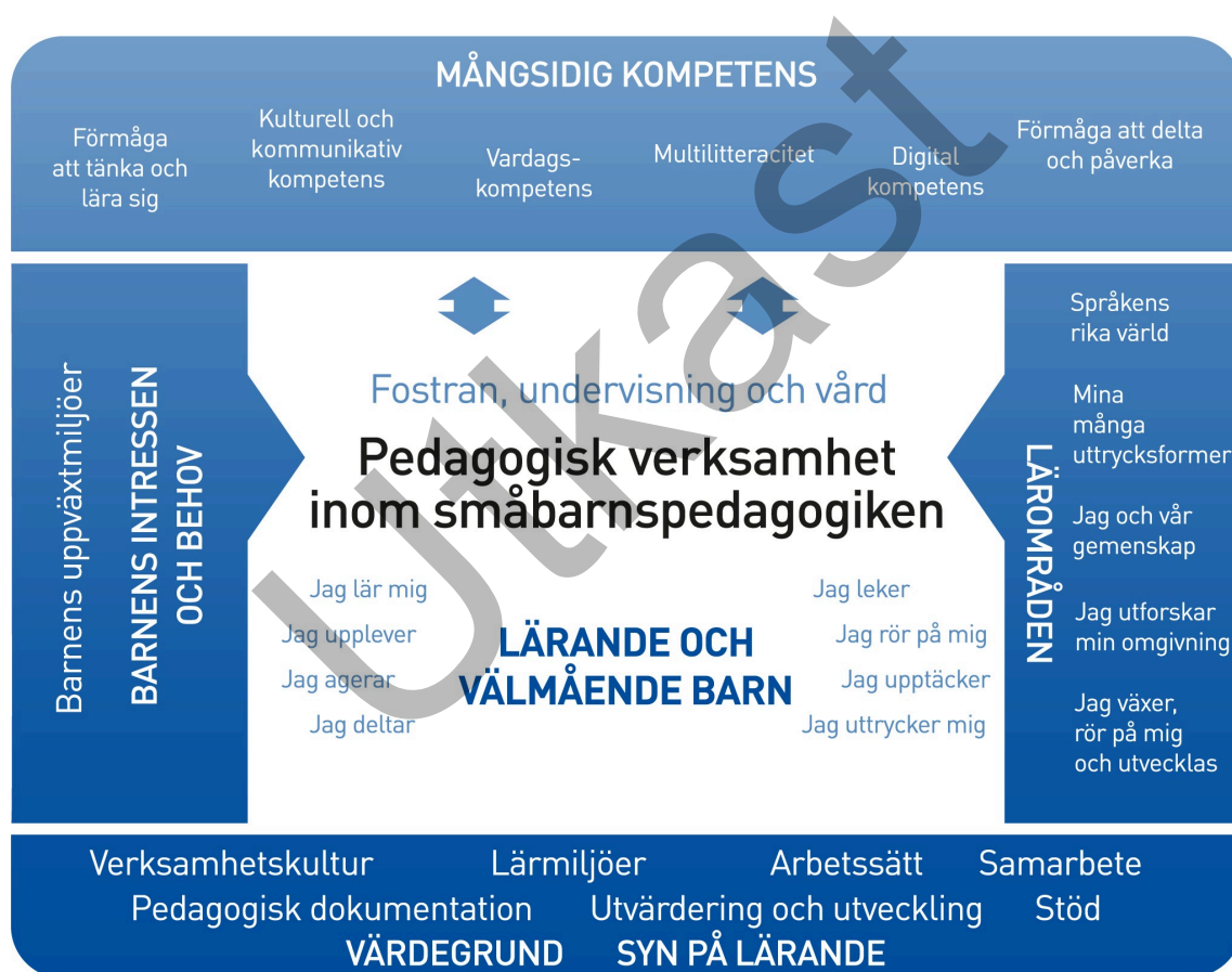
Figur 1. Referensram för den pedagogiska verksamheten

Den pedagogiska verksamheten inom småbarnspedagogiken ska präglas av ett helhetsskapande angreppssätt. Målet är att främja barnens lärande och välbefinnande samt mångsidiga kompetens (figur 1). Den pedagogiska verksamheten förverkligas i samverkan mellan barnen och personalen och i den gemensamma verksamheten. Barnens spontana verksamhet, personalens och barnens gemensamma idéer till verksamhet och verksamhet som planerats av personalen ska komplettera varandra. Den pedagogiska verksamheten inom småbarnspedagogiken ska genomsyra den helhet som består av fostran, undervisning och vård.