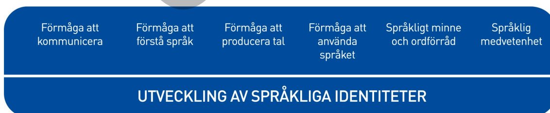
Figur 2. Språkutvecklingens centrala delområden inom småbarnspedagogiken

Med tanke på språkinläringen är det viktigt att vara medveten om att barn i samma ålder kan befinna sig i olika skeden av språkutvecklingen inom olika delområden. De språkliga identiteterna utvecklas när barnen får stöd och handledning inom de centrala delområdena för språkliga kunskaper och färdigheter.