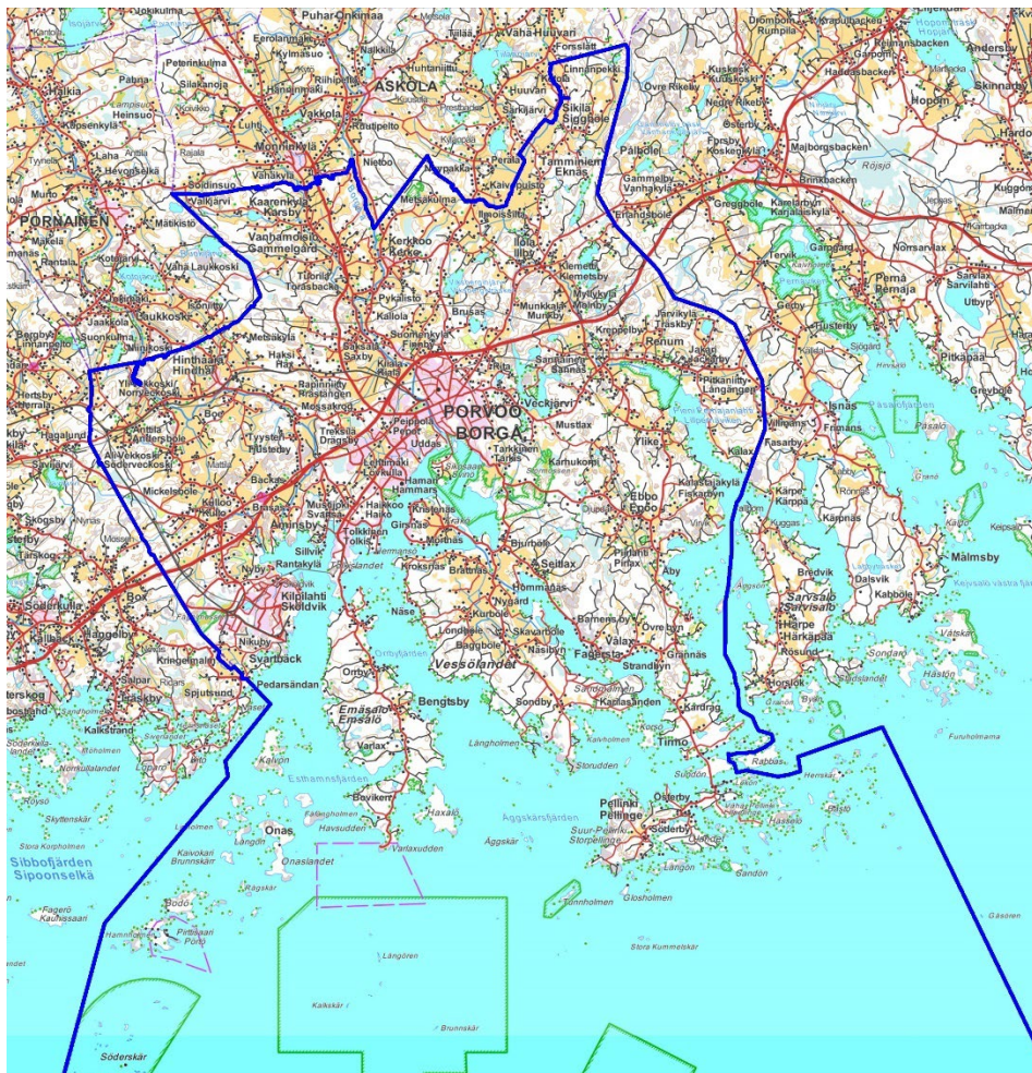
Bild 1 Karta över Borgå stad

Enligt markanvändnings- och bygglagens (i fortsättningen MarkByggl) 15 § när byggnadsordningen bereds skall i tillämpliga delar iaktas vad som bestäms om växelverkan.