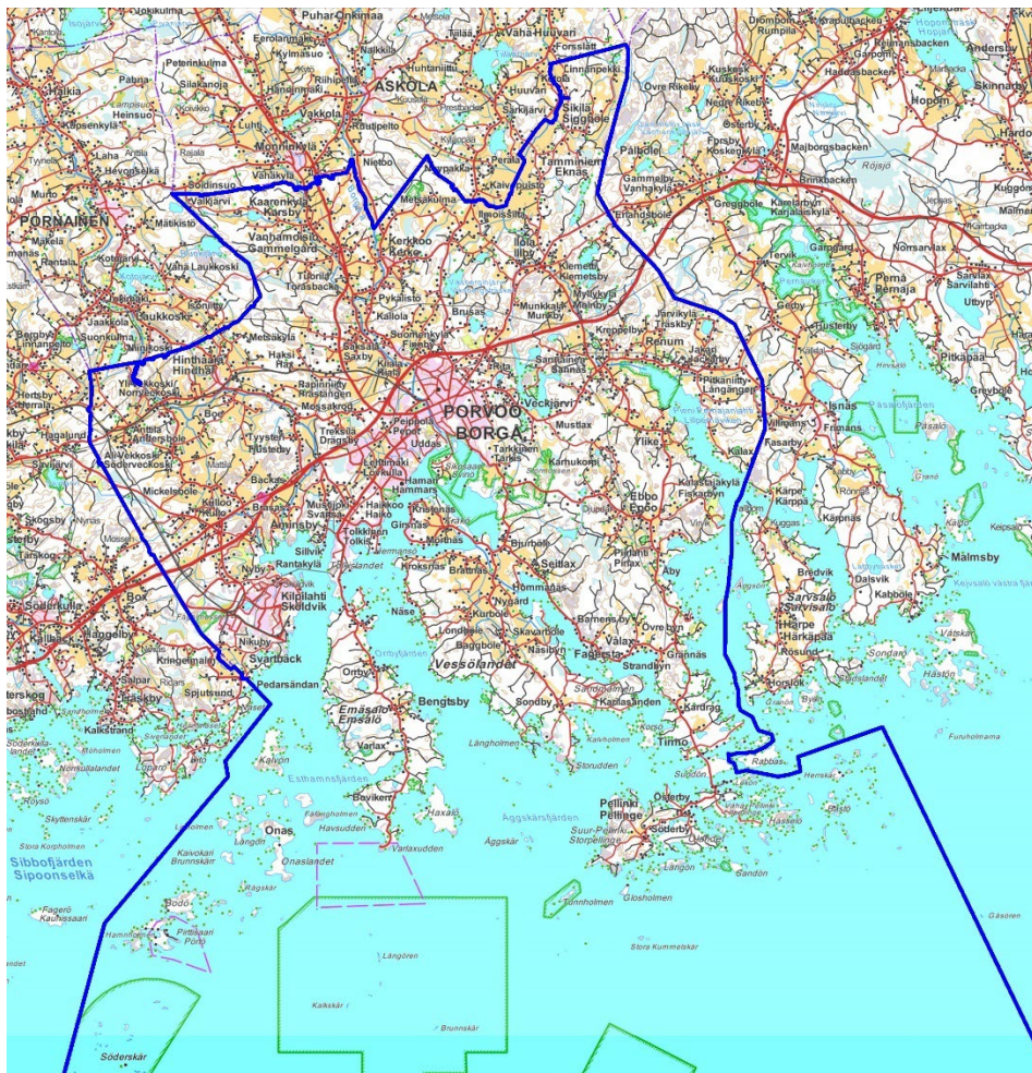
Kuva 1 Porvoon kaupungin kartta

Maankäyttö- ja rakennuslain (jatkossa MRL) 15§ mukaan rakennusjärjestyksen valmistelussa on sovellettava soveltuvilta osin kaavojen valmistelussa käytettävää vuorovaikutusmenettelyä.